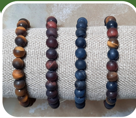
Oeil de tigre version mate