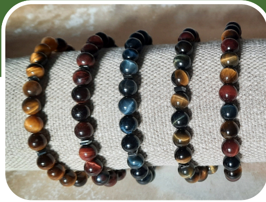
Oeil de tigre

BIJOUX TALISMAN POUR HOMME pour activer votre Masculin Divin